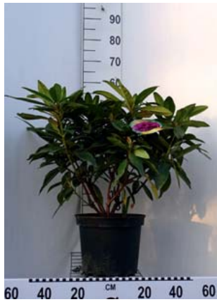
Rhododendron Hybr. Dramatic Dark® C7,5 40-50 cm

Von Flensburg / Kiel A7 Abfahrt 18 Kaltenkirchen rechts → Lentförden/Elmshorn In Lentförden links (B4) → Hamburg/Elmshorn, ca. 9 km nach Bahngleisen an der Ampel rechts → Elmshorn/Barmstedt Von Hamburg A23 Abfahrt 13 → Horst/Elmshorn L288 rechts abbiegen → Wrist/Barmstedt/ Brande-Hörnerkirchen/ Groß Offenseth-Aspern In Groß Offenseth-Aspern rechts Hauptstraße L112 → Brunnenstraße 68, Barmstedt