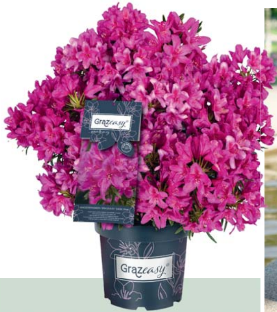
Grazeasy® Dark Pink®