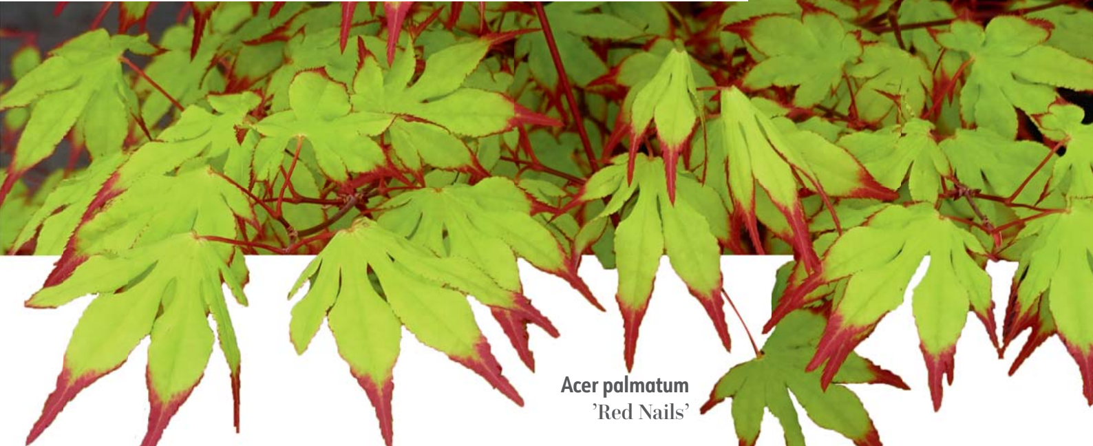
Acer palmatum 'Red Nails'