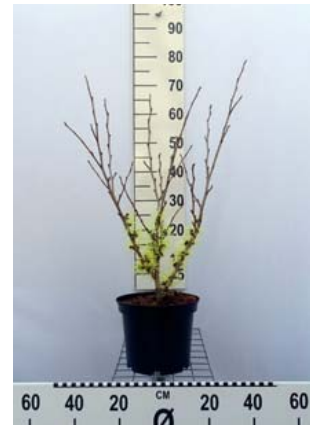
Hamamelis intermedia ,Angelly' C5 40-60 cm