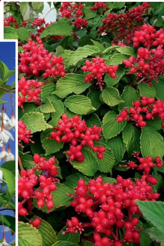
Viburnum plicatum 'Pink Beauty'