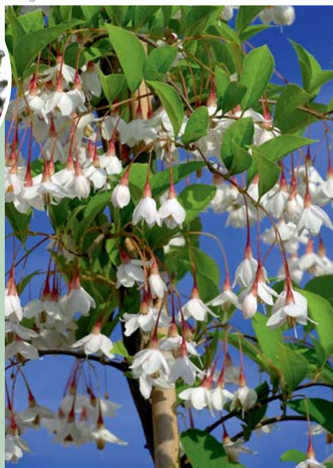
Styrax japonica 'Pendula'