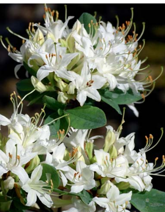
Rh. atlanticum 'Snowbird'