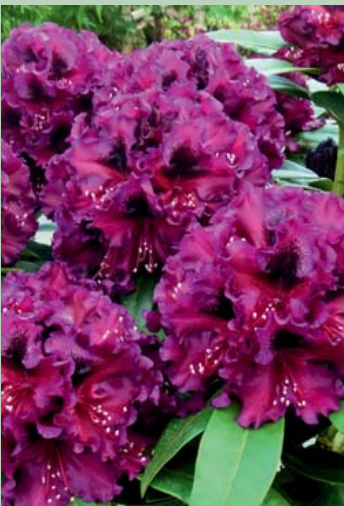
Dramatic Dark® EU