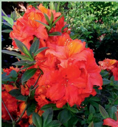
Rh. luteum 'Aprikot'