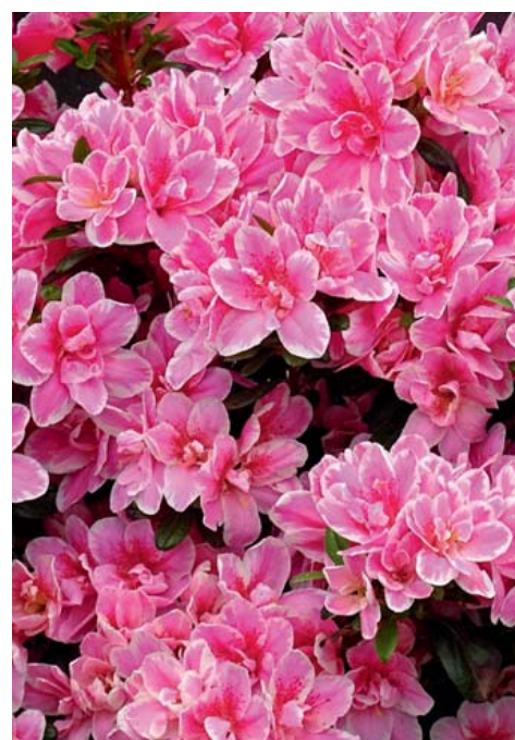
Rh. obtusum 'Pink Poetry'® EU ®

überwältigende Blütenfülle weder immergrün noch sommergrün= wintergrün! besonders schnittverträglich