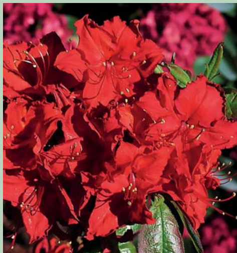
Rh. luteum 'Doloroso'