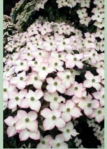
Cornus kousa 'Cappuccino'