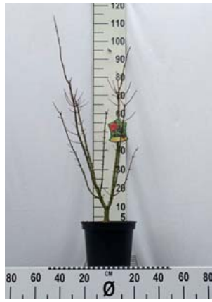
Acer palmatum ,Cristatum' C7,5 80-100 cm