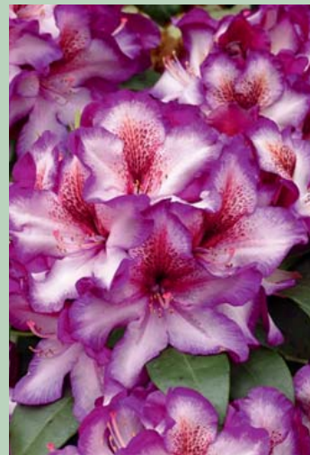
Hans Hachmann® EU