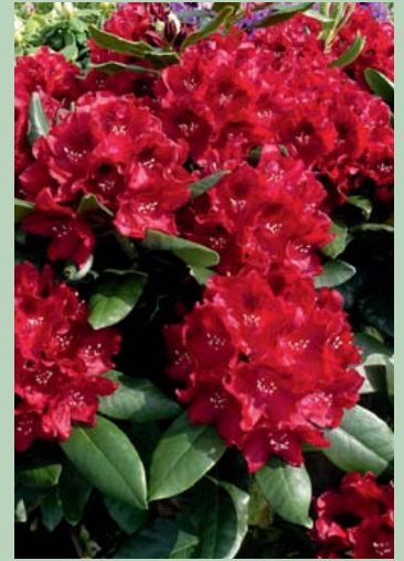
Cherry Kiss® EU