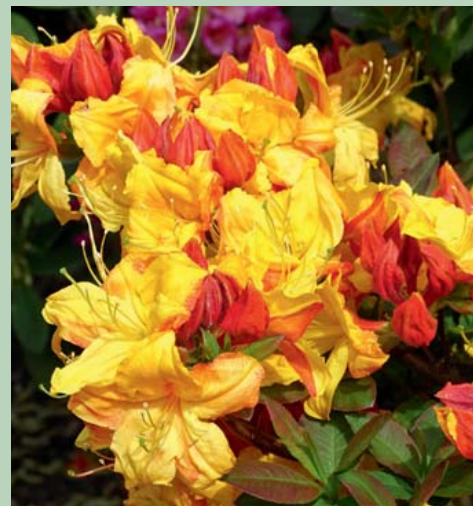
Rh. luteum 'Golden Nectarine'