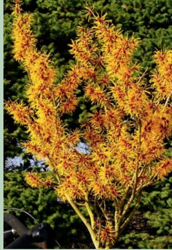
Hamamelis 'Golden Grace'®