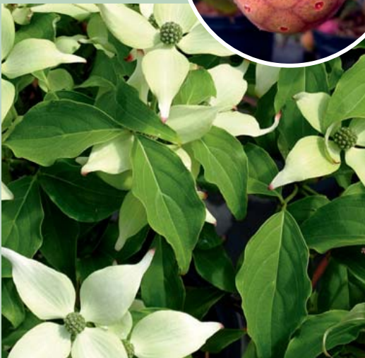
Cornus kousa 'Robert Select' (kl. Bild Frucht)