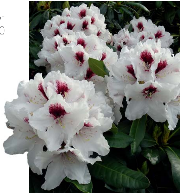
Hachmann's Picobello® EU

Über 100 Sorten auf kalktoleranter Wurzel (Easydendron® von INKARHO®).