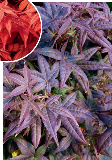
'Rhode Island Red'