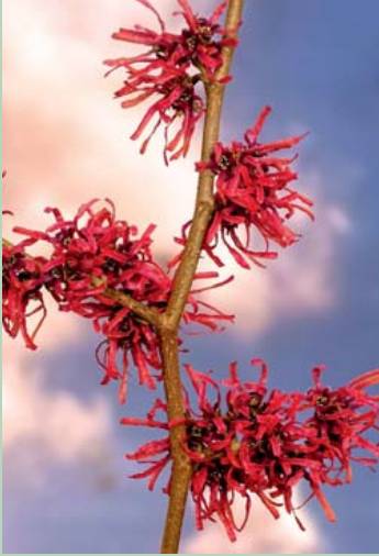
Hamamelis 'Red Grace'