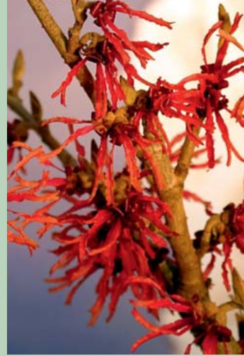
Hamamelis 'Scarlet Grace'