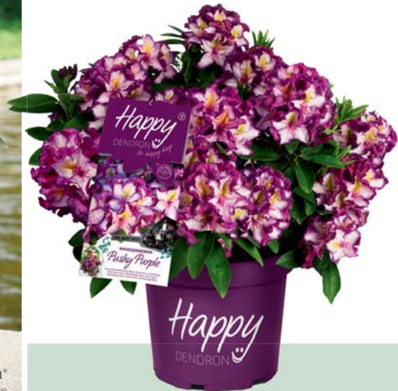
Happydendron® 'Pushy Purple'